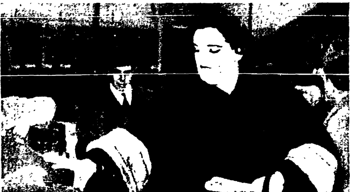
PALERMO - Anita Cerquetti all'arrivo alla stazione centrale

Immediata sostituzione - Il soprano era subentrato alla Callas nella "Norma" a Roma