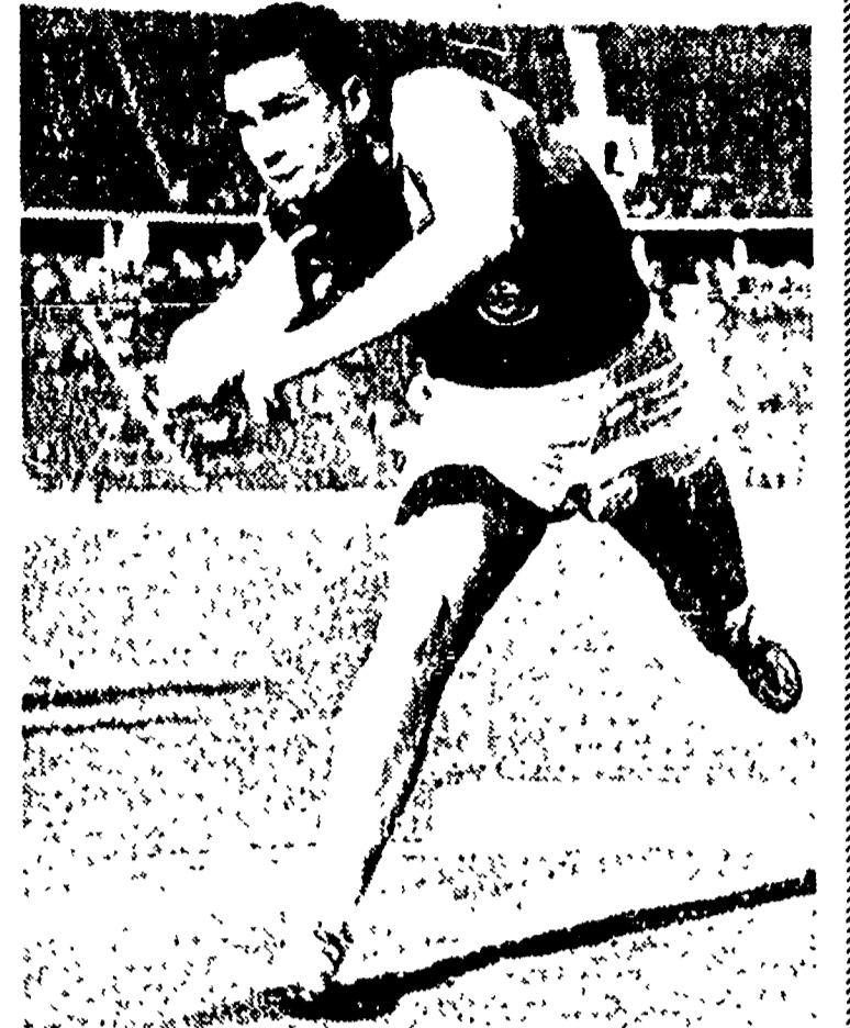
MOSCA, 22. - L'Unione Sovietica ha invitato una squadra di atletica leggera americana a partecipare alla grande riunione internazionale che si terrà nella capitale sovietica nelle giornate del 5 e 6 luglio, alla quale parteciperanno 300 atleti.