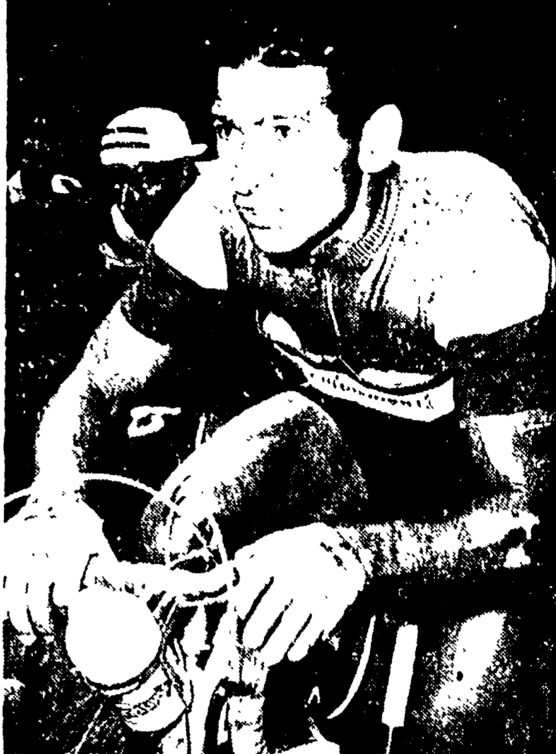
NENCINI ha un ambizioso programma per la stagione 1958: ma la sua serietà è garanzia di successo

La preparazione per la prossima stagione sarà lunga e dura. Nencini è un corridore che si prepara per tutto il mondo. Per lui, la preparazione è un'arte. Ha una disciplina ferrea e una volontà di ferro. Non si arrende mai.