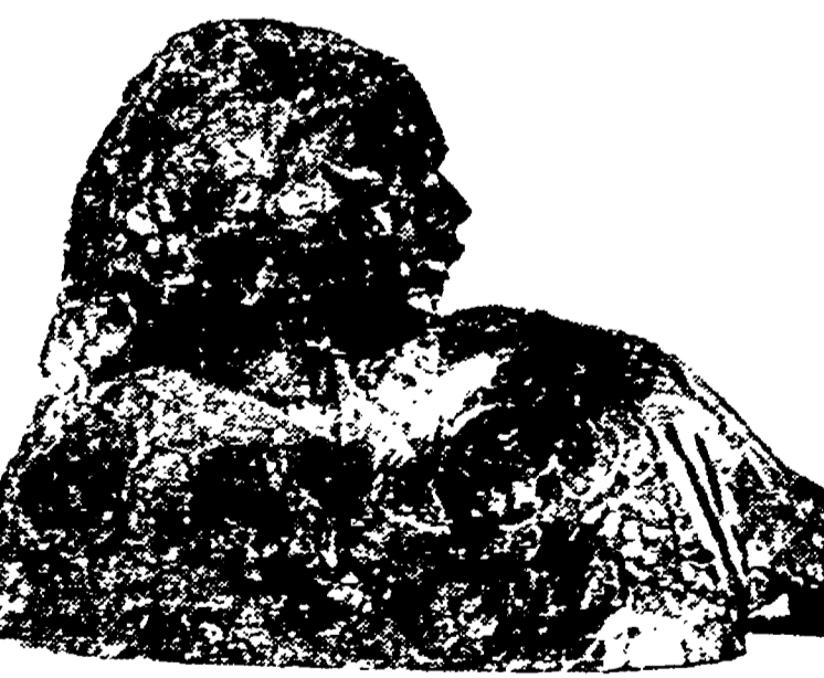
ROBERTO MELLI: «Mia moglie» (1913)

Attualità d'una lezione, a un mese dalla morte dell'artista