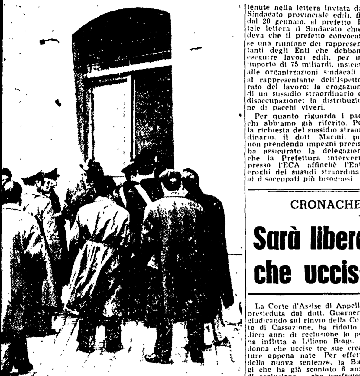
NON E' LA CASA DEL DELITTO - Più poliziotti e carabinieri che persone s'invano davanti all'ingresso, ma non è il portone di una stabile dove stanno commettendo un delitto: questo è il via di uno degli ingressi dell'Ufficio di Collocamento che quasi ogni mattina viene assediato dai poliziotti mentre i disoccupati sono obbligati a sostare nell'intervallo dell'edificio.

Le richieste del Sindacato edili ribadite in Prefettura dall'on. Cianca e da una delegazione di lavoratori - L'Ufficio di collocamento di nuovo assediato dalla PS