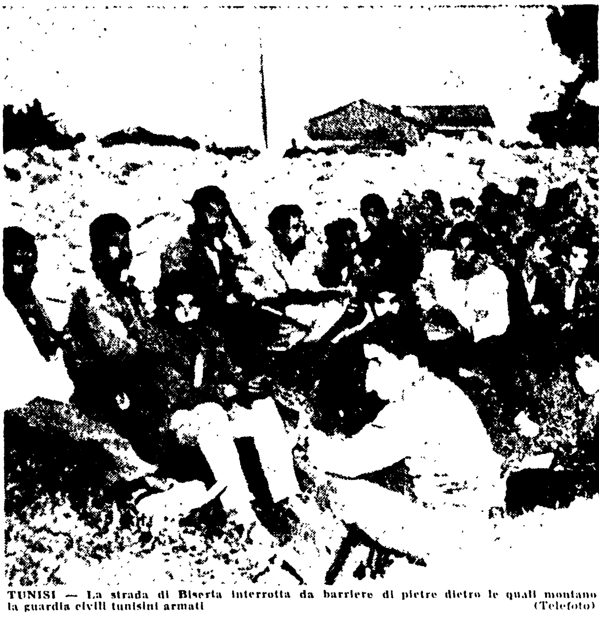
TUNISI - La strada di Biveria interrotta da barriere di pietre dietro le quali montano la guardia civili tunisini armati