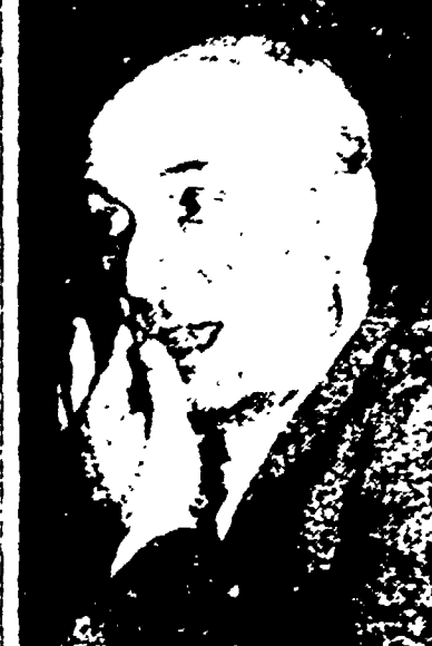
Chi può dire che Fanfani non pensa alla famiglia?