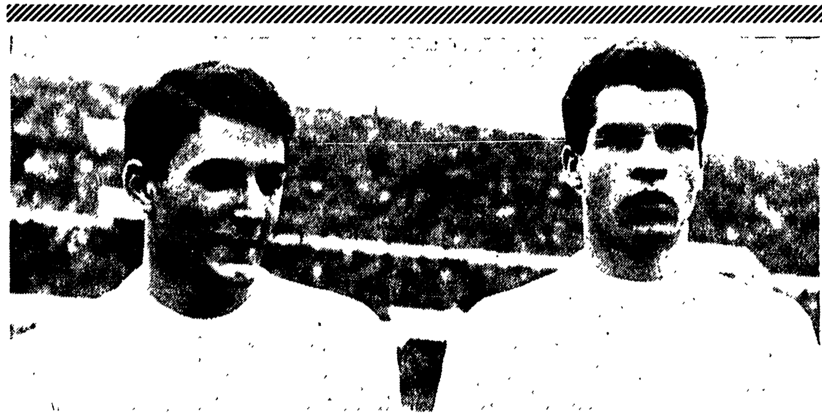
Tanto ormai il torneo è finito e in campo internazionale non abbiamo più nulla da perdere dopo l'eliminazione dal mondo.

E poi non tanto vincere importa quanto gareggiare e dare possibilità ai giovani di fare nuove esperienze, di acclimatarsi al migliore il loro bagaglio che naturalmente implica una certa cura che purtroppo la FIGC e il Settore tecnico federale non hanno mai dimostrato. Ma a questo potrebbero supplire le società, se dedicassero maggiori attenzioni ai vari giovani.