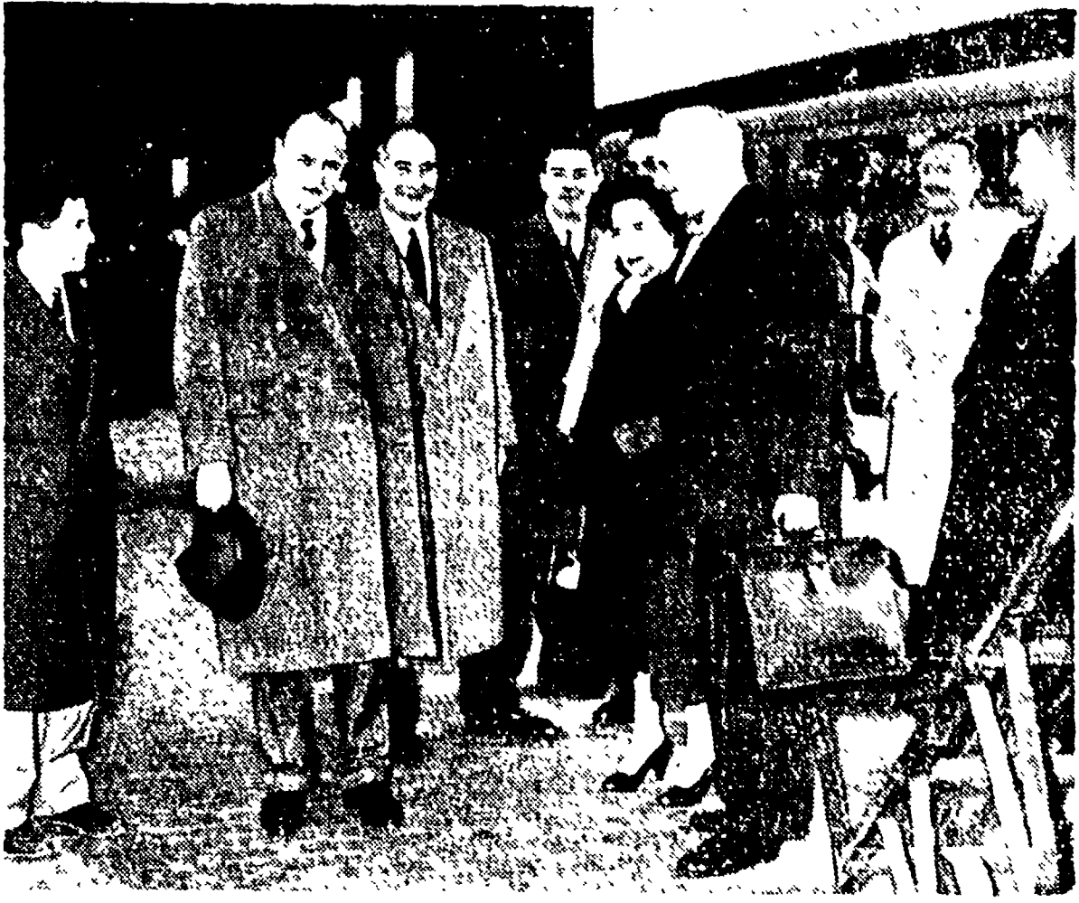
E' arrivata ieri pomeriggio a Roma da Parigi una delegazione del Partito comunista francese...