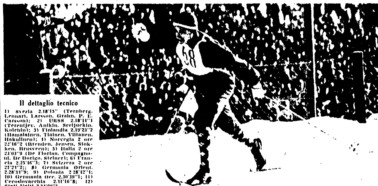
Il dettaglio tecnico