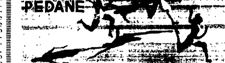
SU PISTE E PEDANE