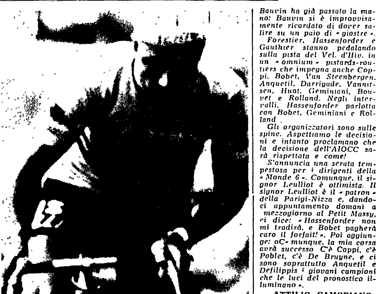
Baurin ha già passato la mano: Baurin si è improvvisamente ricordato di dover uscire su un paio di "giostre"...