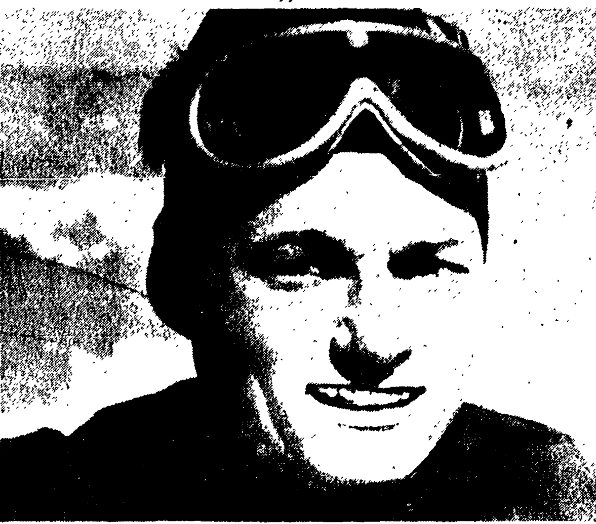
SAINT ANTON, 9. - Ripetendo il risultato del connazionale Mollerer, l'austriaco Schranz ha vinto per la seconda volta consecutiva la combinata del Kandahar...