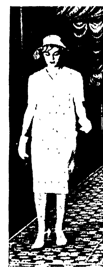
glio, scivolato, morbide, senza alcun punto di appoggio - anatomico - il seno, infatti, deve essere appena accennato, le anche accarezzate appena, la vita, poi, la si indica e non la si segna, attenti) o alla, quasi sotto il seno, o assai bassa e comunque mal al punto giusto. Le spalle saranno

Se qualcuna delle nostre lettrici non si lascia spaventare da quest'ondata di freddo invernale e vuol continuare a pensare come sarebbe di regola, secondo il calendario - al tailleur per la primavera, ci troveremo pronti con tutti quei suggerimenti e quelle novità che la interessano.