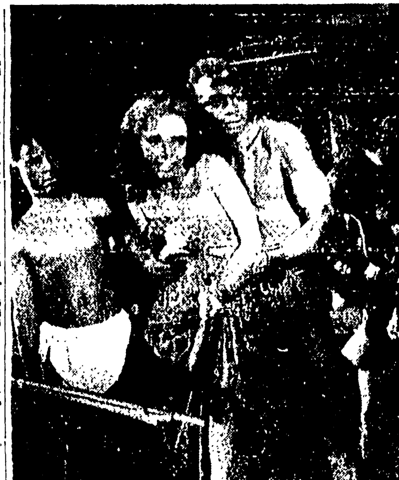
La bellissima Dorothy Dandridge, con la vedova nel superbo cine-scenope recitato da TAMANGO a fianco del bravissimo CRO JURGENS.

Prima Visione: Adriano: Tommaso, con C. Jur-