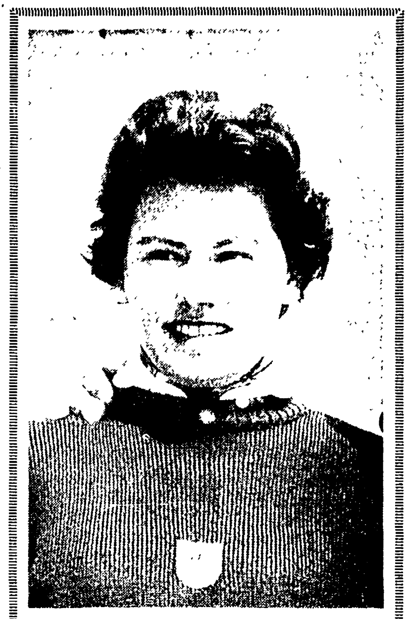
Domani all'Abelone la «Coppa Foemina»

Palermo ed il Padova. A meno che facendo i nomi delle squadre sospette la Lega non abbia potuto sperare il seguire l'esempio del Torino e della Sampdoria.