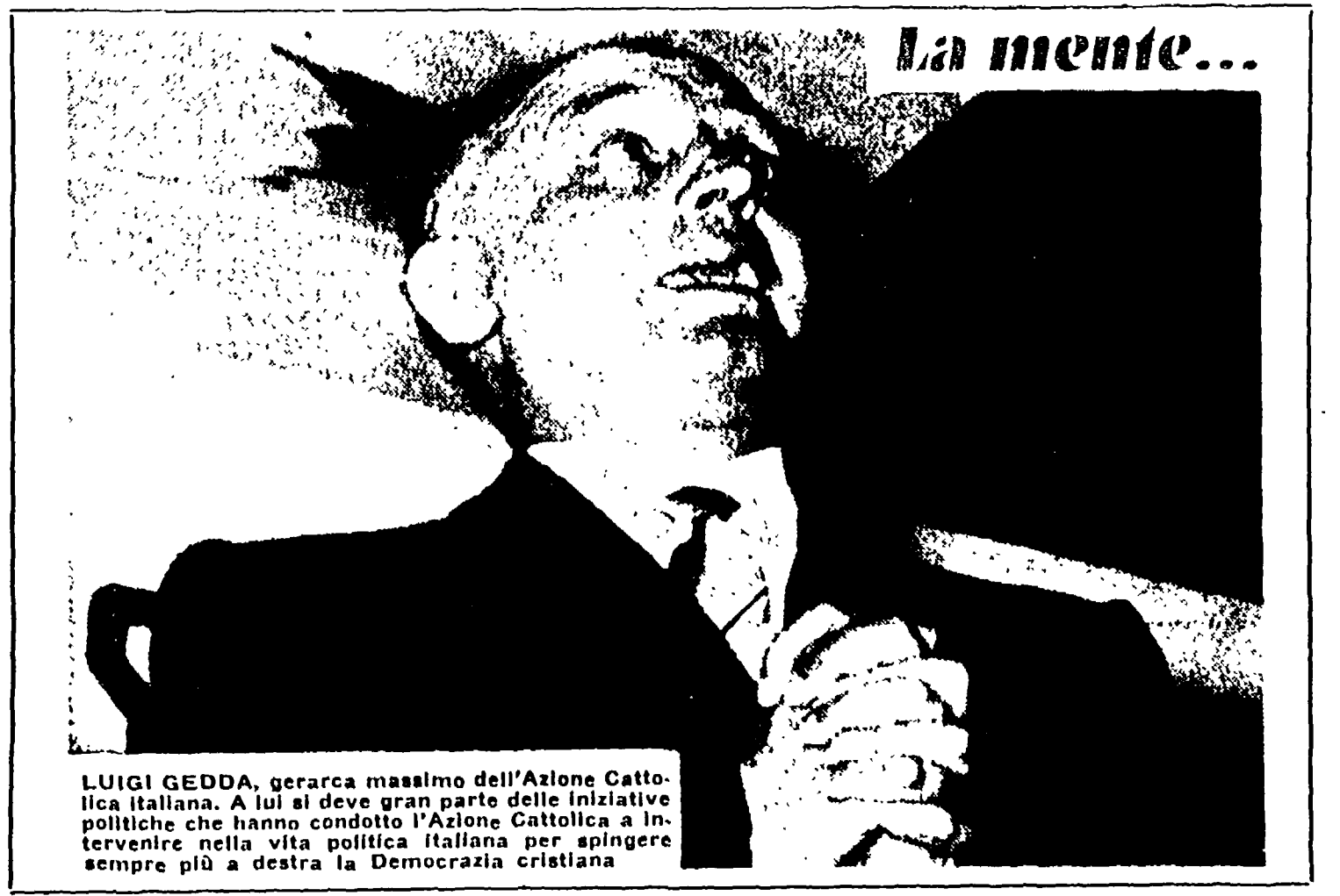
LUIGI GEDDA, gerarca massimo dell'Azione Cattolica italiana. A lui si deve gran parte delle iniziative politiche che hanno condotto l'Azione Cattolica a intervenire nella vita politica italiana per spingere sempre più a destra la Democrazia cristiana

Esiste il Com. Civico. La DC ha la sua attività è molto discussa dal Com. Civico nonostante il presidente di questo sia anche consigliere della DC.