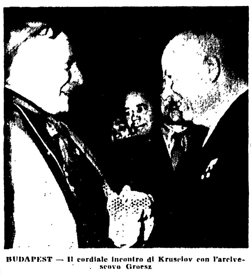
BUDAPEST - Il cordiale incontro di Krusciov con l'arcivescovo Grosz.

La partenza da Budapest... Krusciov ha così concluso: «La delegazione dell'URSS reca con sé il saluto del popolo ungherese al popolo sovietico e un messaggio affermatore che gli ungheresi sono amici sinceri dei sovietici. Viva l'unità del grande campo socialista. Viva la pace nel mondo. Arrivederci, cari compagni e amici!».