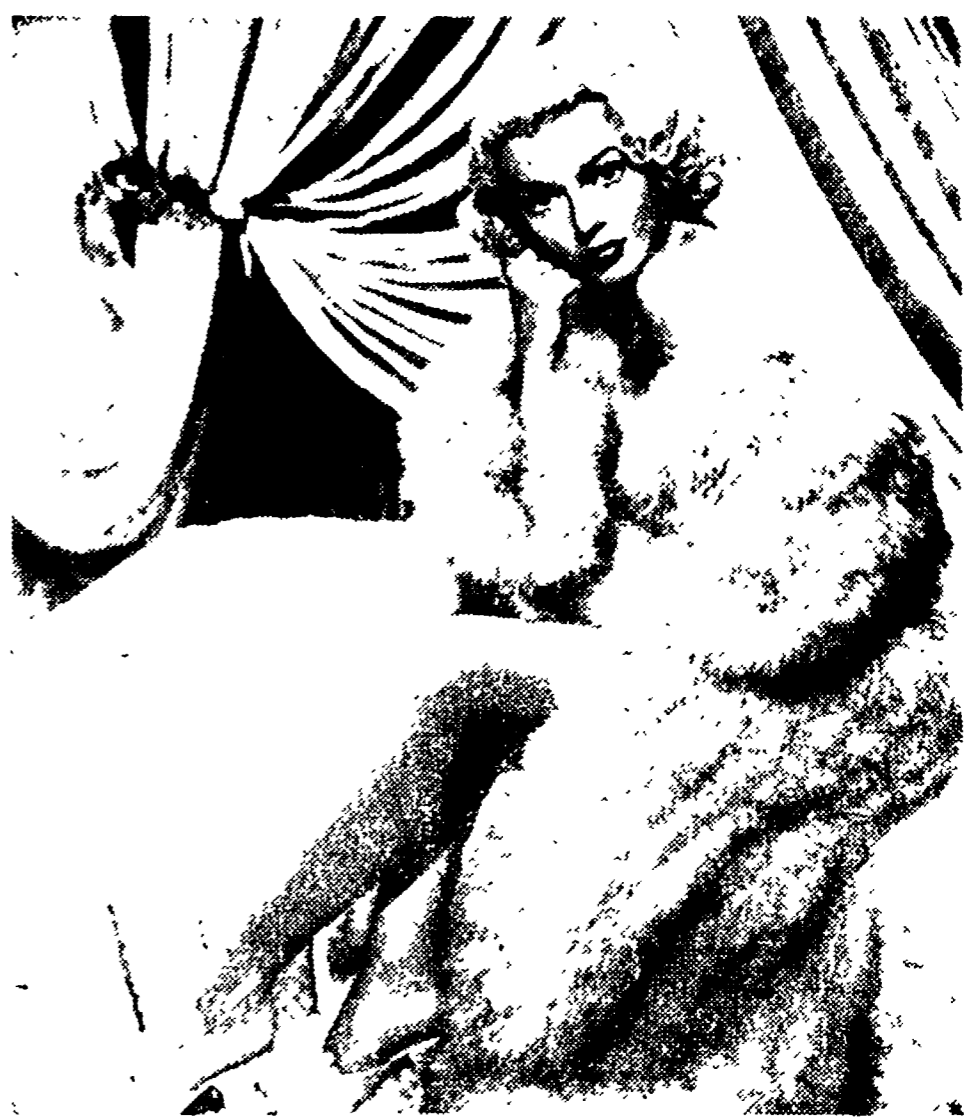
Lana in un film di alcuni anni orsono: l'attrice era allora nel suo pieno splendore. Con l'interpretazione dei «Peccatori di Peyton», ha sfiorato l'Oscar e pareva che per lei stesse per schiudersi una nuova splendida stagione. Le perdoneremo i magnati di Hollywood il recente scandalo?

La morte di Dragna segnò la definitiva affermazione del piccolo Mickey. Un ragazzo neorichiese (è nato nel 1911 a Brownsville, Brooklyn) divenne un personaggio splendido. Fu visto girare a bordo di una Cadillac trasformabile color pastello, uno stecchino d'argento stretto in mano, i capelli impannocciati in abiti di gabbardine lilla o giallo d'uovo, sorridente e sicuro. Gli affari andavano bene. Mickey oggi è considerato uno dei padroni di Hollywood.