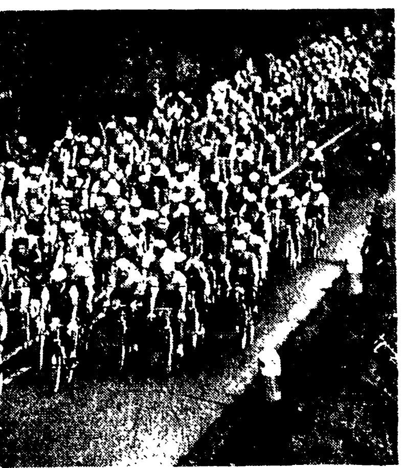
INTERESSANTE DOMENICA IPPICA SUGLI IPPODROMI ITALIANI

BUENOS AIRES. 12. — Il comitato Direttivo dell'Associazione Argentina di Calcio ha annullato, a causa delle difficoltà di trasporto, la partita che doveva opporre domenica prossima a Asuncion il Paraguay all'Argentina.