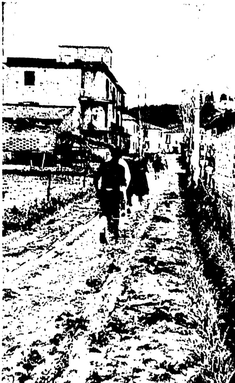
UN MARE DI FANGO — Una strada di Prima Porta dopo l'alluvione della scorsa notte.

Il presidente dell'azienda ha rifiutato ogni discussione — Osere minacce alla libertà di sciopero — Stasera il problema al Consiglio comunale — Una dichiarazione di Rubeo