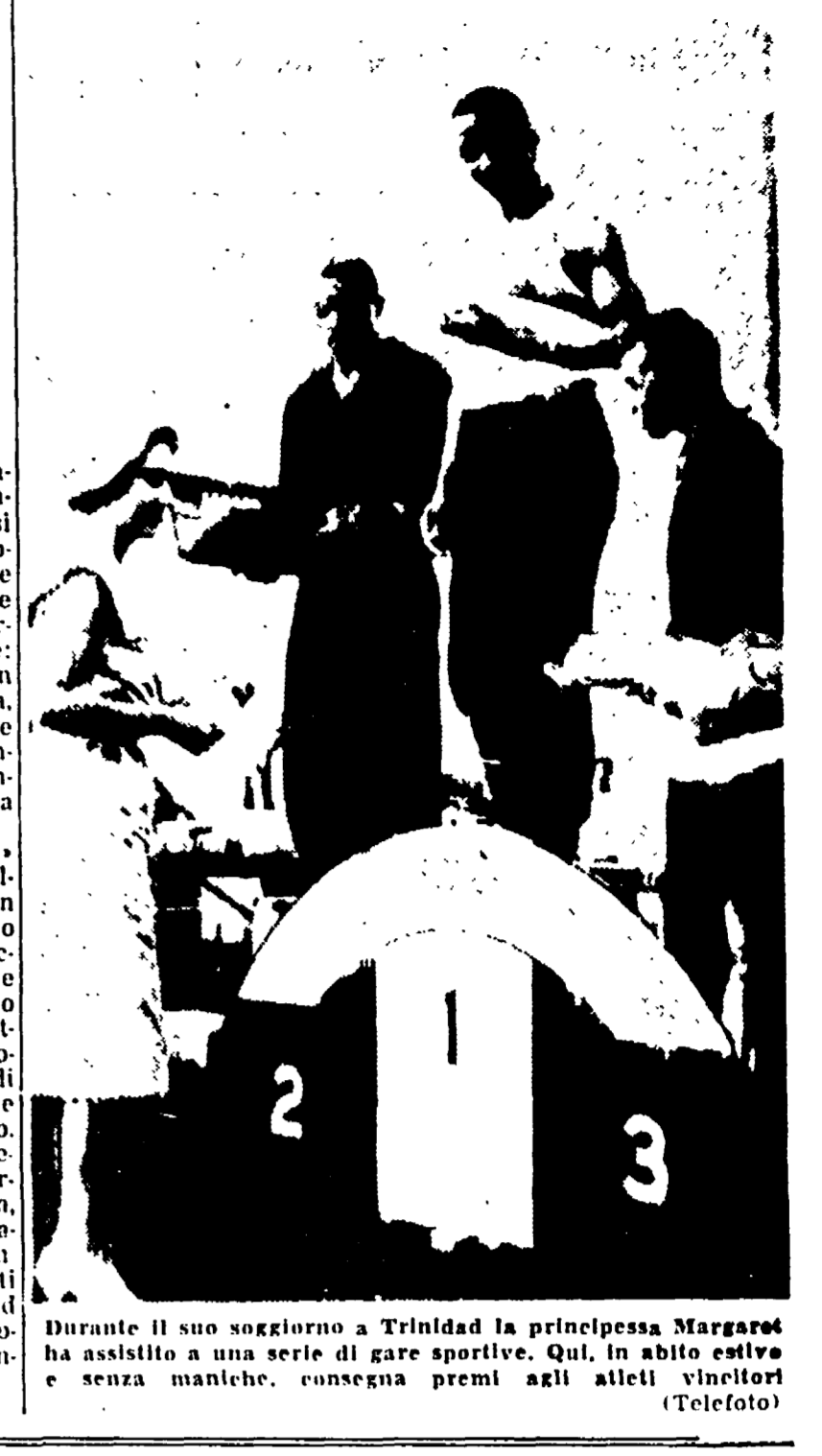
Durante il suo soggiorno a Trinità la principessa Margaret ha assistito a una serie di gare sportive...