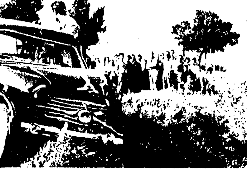
VIA TRIONFALE — La 1100 — fuori strada dopo il terribile urto con la moto

Nel superare un autobus, un bracciante in moto cozza contro un furgoncino: il conducente è fuggito — Due cacciatori si scontrano con un'auto — Un calzolaio travolto da uno scooter