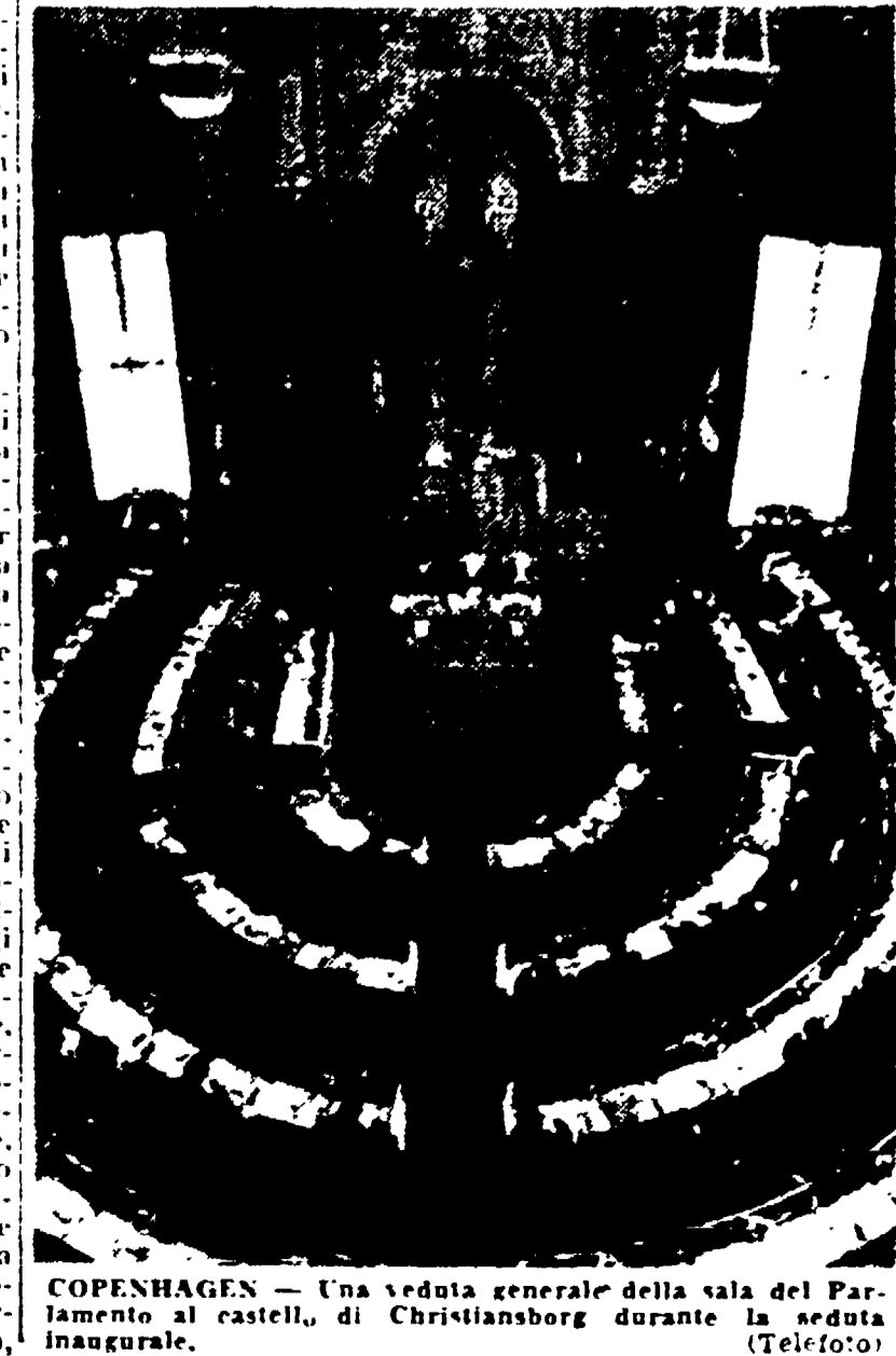
COPENHAGEN - Una veduta generale della sala del Parlamento danese, di Christiansborg durante l'inaugurazione.

INGRAO: Le responsabilità dell'anticomunismo nello aggravamento della minaccia clericale contro la laicità dello Stato