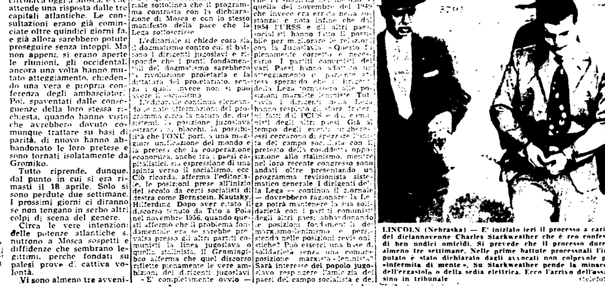
LINCOLN (Nebraska). - È iniziato ieri il processo a carico del diciannovenne Charles Starkweather che è reo confesso di ben undici omicidi. Si prevede che il processo durerà almeno tre settimane. Nelle prime battute processuali l'imputato è stato dichiarato dagli avvocati non colpevole per «infermità di mente». Su Starkweather pende la minaccia dell'ergastolo e della sedia elettrica. Ecco l'arrivo dell'assassino in tribunale.

«Il revisionismo moderno — a detta del Genmingbao — è un programma che si differenzia dal marxismo-leninismo in quanto non riconosce la necessità di una rivoluzione proletaria e la dittatura del proletariato, senza la quale non si può realizzare il socialismo. Il Genmingbao si chiede cosa sia il revisionismo moderno e come si differenzia dal revisionismo classico.