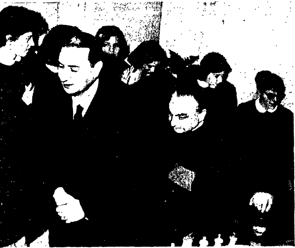
L'on. Moro in uno dei suoi più caratteristici atteggiamenti

Nello stesso giorno, il suo rivale, il sottosegretario allo Spettacolo Rest, riesce a partecipare a due convegni, di operatori economici e di bandisti - Una «apallà», preziosa e ben compensata per il ministro della P.I. - Cinque vescovi al suo fianco