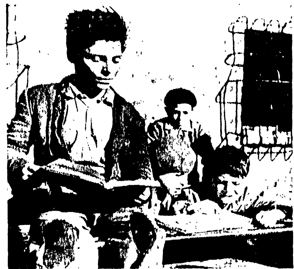
Nelle due fotografie un'impressionante denuncia della situazione della scuola del nostro paese. Non si sa bene quale coraggio ammirare di più: se quello degli alunni o quello dei maestri. Ma questa disperata battaglia contro l'ignoranza sembra interessare ben poco i nostri governanti. Che continuano a deporre i primi pietra a deporre ed a mangiarla mentre il numero delle aule scolastiche continua ad essere paurosamente basso.

I preziosi insegnamenti che si possono ricavare dall'esperienza sovietica - In Cina si sta tentando una delle più colossali imprese in questo campo - L'influenza dell'industrializzazione sulla frequenza scolastica - Il problema dei paesi coloniali