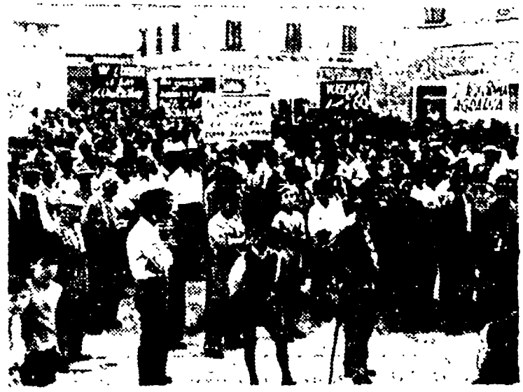
Le lotte dei contadini per la riforma agraria sono state tradite dalla D.C. che ha cancellato questa rivendicazione dal suo programma. Nella foto: una recente manifestazione per la terra

Questo deve essere il primo passo per garantire che al posto della politica dettata dagli interessi dei monopoli e della grande proprietà terriera sia realizzata LA RIFORMA AGRARIA PER DARE LA TERRA A CHI LA LAVORA E DIFENDERE I COLTIVATORI DIRETTI IN BASE AI PRINCIPI DELLO STATUTO PER LA PICCOLA PROPRIETA' E AZIENDA CONTADINA.