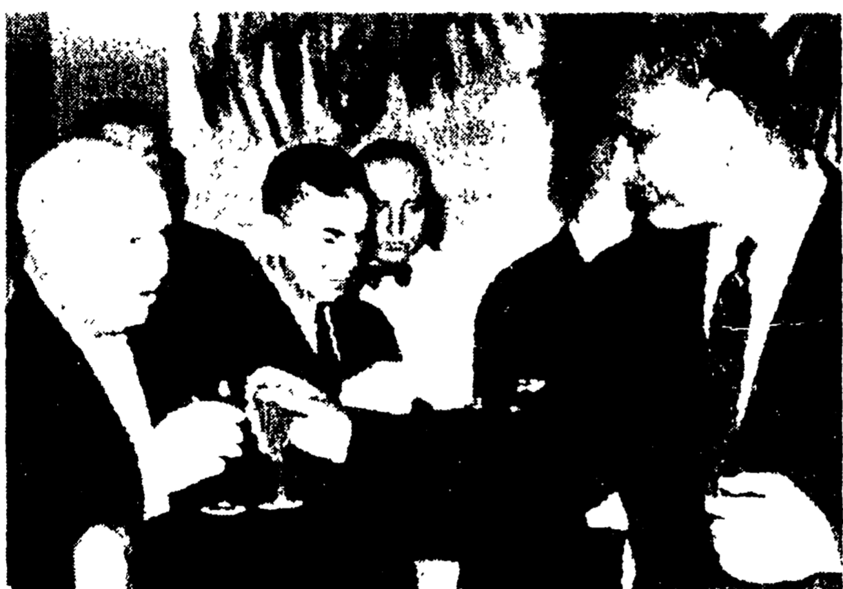
MOSCA - Krusciov e Sasser brindano nel corso del ricevimento all'Hotel Sovetskaja offerito dall'ambasciata della Repubblica araba unita