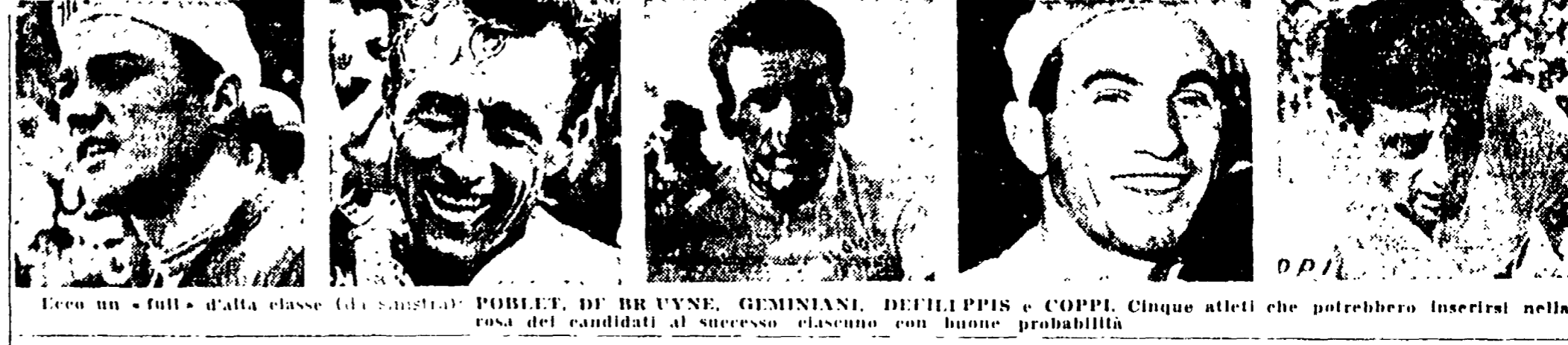
Ecco un "full" della classe (da sinistra) BOBET, DI BRUYNE, GEMINIANI, DEFILIPPIS e COPPI. Cinque atleti rosa del candidato al successo ciascuno con buone probabilità

(Dal nostro inviato speciale) MILANO, 17. — Buongiorno a te Italia, meraviglioso e amato Paese che il "Giro", corsa della nostra passione e festa di sport e di follia che più bella non si può immaginare, ogni anno ci permette di percorrere a maggio, quando dappertutto fiammeggiano le rose, le ragazze sono in fiore, i prati si arrossano di papaveri, le campagne sono di un verde nuovo e sbucano, in un'isola di un turchino druso e soleggiato, tutto schiuffi e capricci di spume iridescenti, e lo splendore della primavera scende deliziosamente il sangue, e la gente corre incontro al "Giro" eccitata da una corrente incantata: l'entusiasmo.