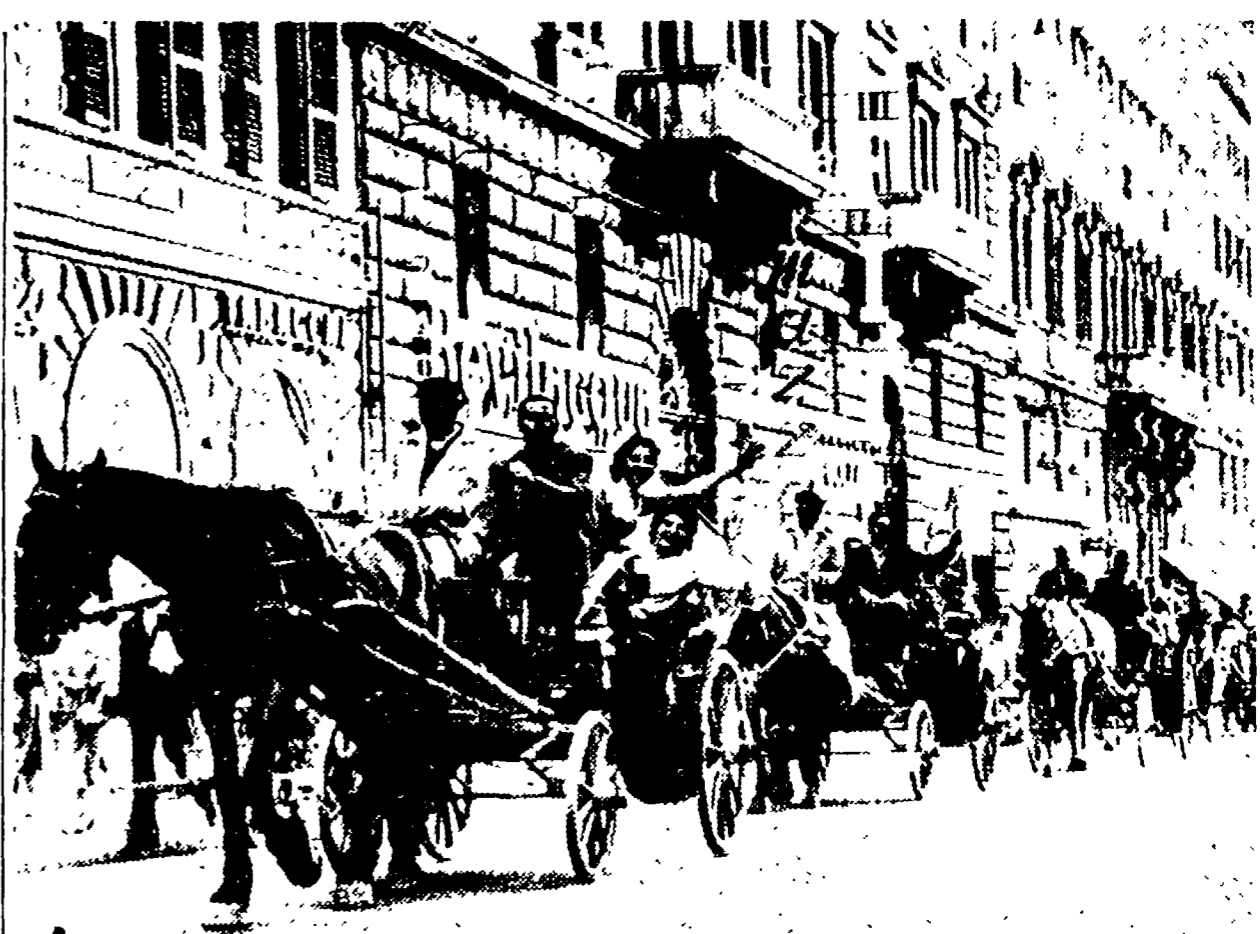
S. GIOVANNI 1956 — Le carrozzelle trasportano intere famiglie a piazza S. Giovanni. La grande manifestazione di chiusura della campagna elettorale del nostro Partito è sempre stata contrassegnata dalla calorosa partecipazione di grandi folle di popolo. Anche nel 1956 il PCI aumentò i suoi voti

Rispondendo all'appello lanciato dal Comitato Direttivo provinciale della Federazione giovanile per la diffusione dell'«Unità» di domani e di domenica, alcuni Circoli hanno già comunicato i loro impegni. Nel quadro delle prenotazioni delle sezioni del Partito, i seguenti Circoli si sono impegnati a diffondere il numero di copie a fianco segnato: GARBATELLA 200 sabato e 600 domenica; TRIONFALE 100 sabato e 150 domenica; SALARIO 100 sabato e 80 domenica; APPIO (ragazze) 100 sabato e 100 domenica; CAMPITELLI 50 sabato e 10 domenica; S. GIOVANNI 50 sabato e 80 domenica; OSTIENSE 50 domenica; S. LORENZO 50 domenica; MONTE MARIO 100 sabato Il C. D. invita tutti gli altri circoli a seguire questi esempi e a comunicare in giornata i nuovi impegni.