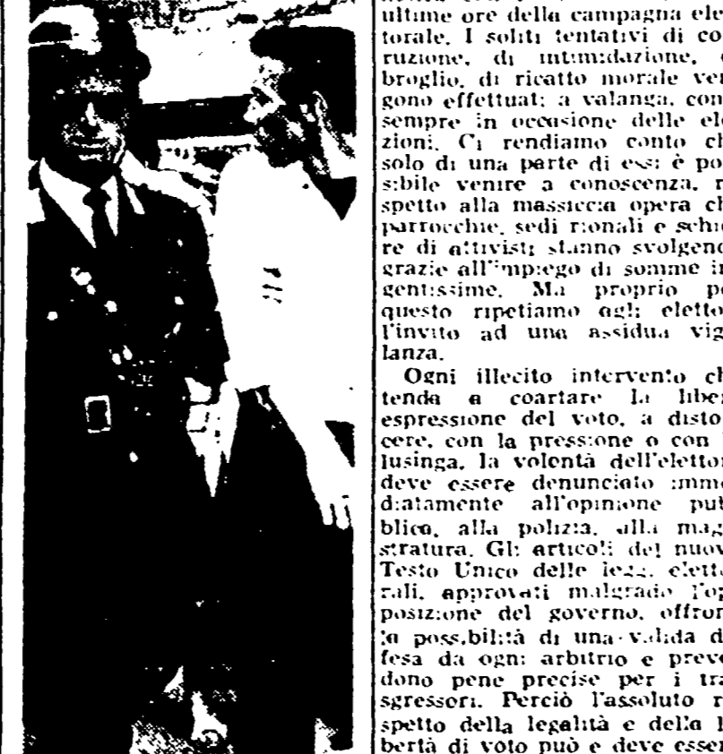
Il ladro dopo la cattura