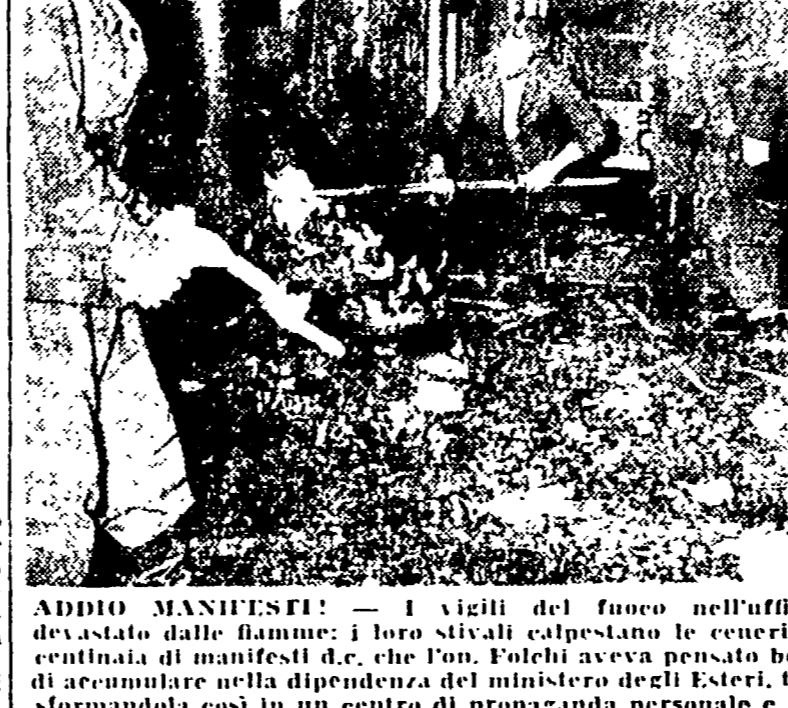
ABBUO MANIFESTI — I vigili del fuoco nell'ufficio devastato dalle fiamme; i loro sivali calpestante le ceneri di centinaia di manifesti d.e. che l'on. Folchi aveva pensato bene di accumulare nella dipendenza del ministero degli Esteri, trasformandola così in un centro di propaganda personale e d.e.

Tutti gli impiegati erano ad ascoltare un comizio del sottosegretario - Danni per 100 mila lire