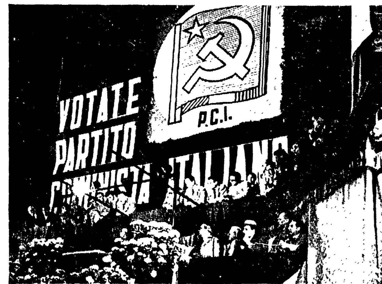
S. GIOVANNI 1953 — Il compagno Palmiro Togliatti mentre parla nella indimenticabile manifestazione tenuta a chiusura della campagna elettorale del 7 giugno. La grande battaglia politica di quell'anno portò alla sconfitta della legge truffa e segnò un balzo in avanti del nostro Partito