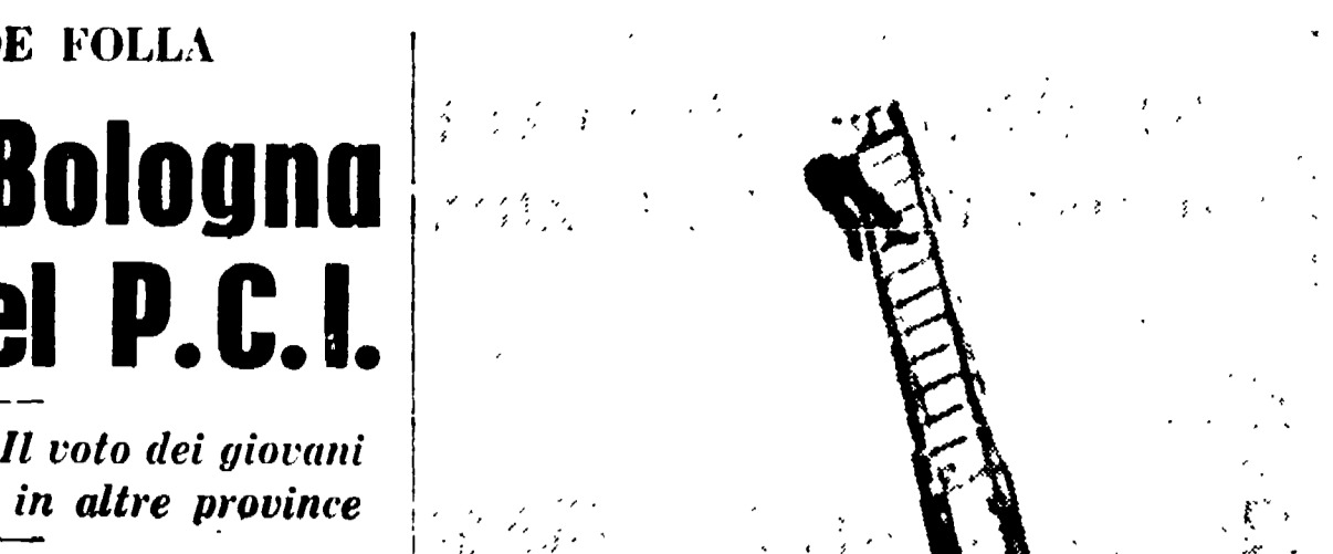
Muore un palombaro presso Lampedusa

Gli eletti comunisti - Nel PSDI Preti batte Martoni e nel PRI La Malfa supera Macrelli - Il voto dei giovani è andato per il 38,47 per cento al PCI, nonostante che le classi di leva abbiano votato in altre province