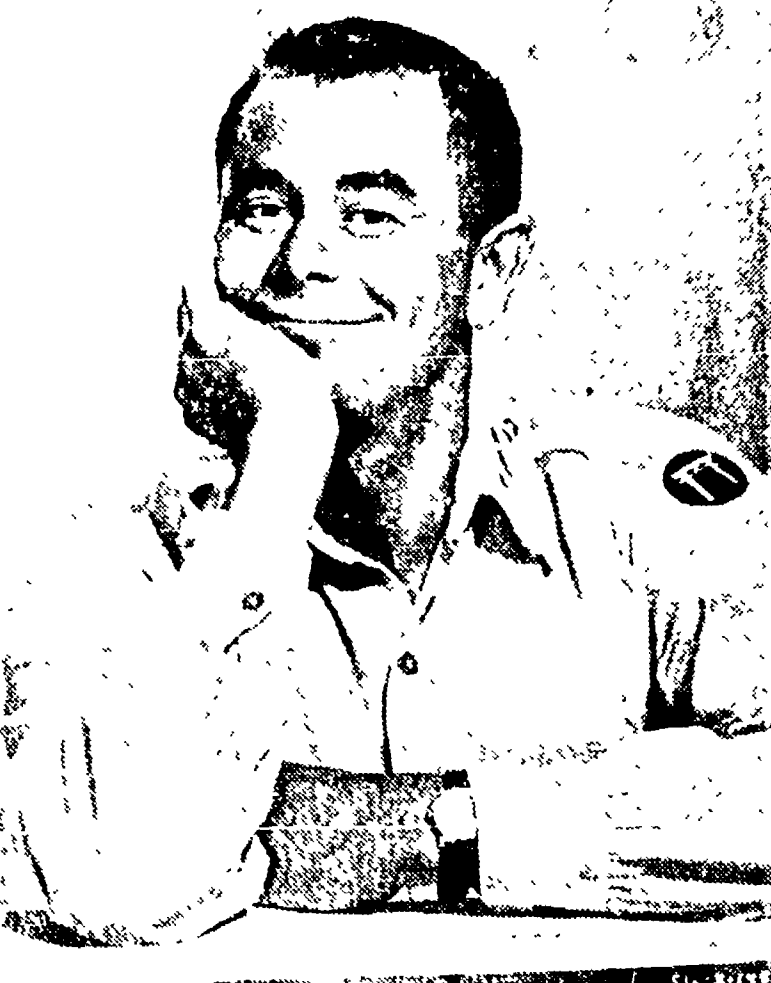
GLENN FORD e il brillantissimo protagonista del Cinema-scopo a colori M.G.M. «ALLA LARGA DEL MARE»