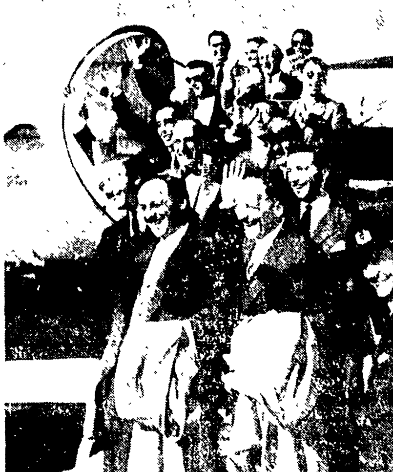
Sono arrivate ieri da Londra a Campina, le 16 coppie di gemelli «con tendenza alla calvizie». Saranno visitate da un noto medico romano...