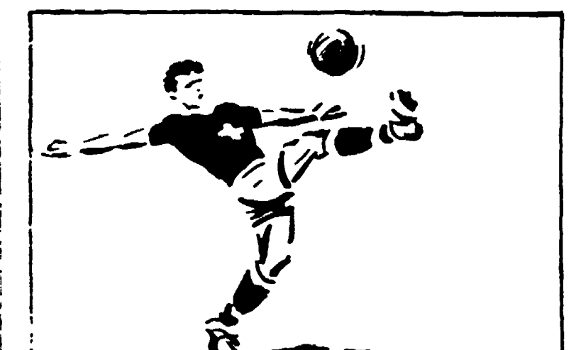
Anche domenica prossima appuntamento col Totocalcio

IL CAMPIONATO SVIZZERO ritorna a distribuire MILIONI insieme al CAMPIONATO ITALIANO DILETTANTI