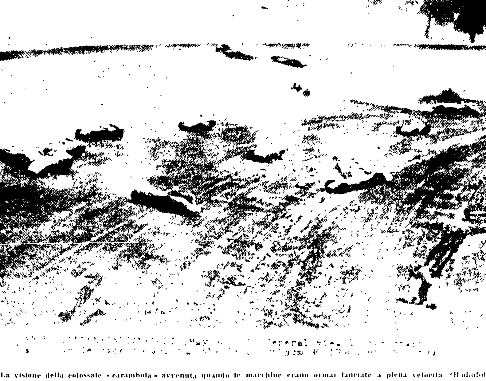
La visione della colossale «carambola» avvenuta quando le macchine erano ormai lanose a piena velocità. (R. Diotalevi)

Il vincitore ha battuto in volata otto compagni di fuga: Fantini, Boni, Junkermann, Dall'Agata, La Cioppa, Barale, Catalano e Coletto - Mancini a 12'23" - il grosso a 12'27"