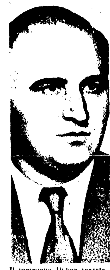
Il compagno Jivkov segretario del P.C. bulgaro

sviluppano. Nell'attuale situazione, ha concluso Jivkov, spiccano nettamente due aspetti della questione dell'unità del movimento comunista internazionale.