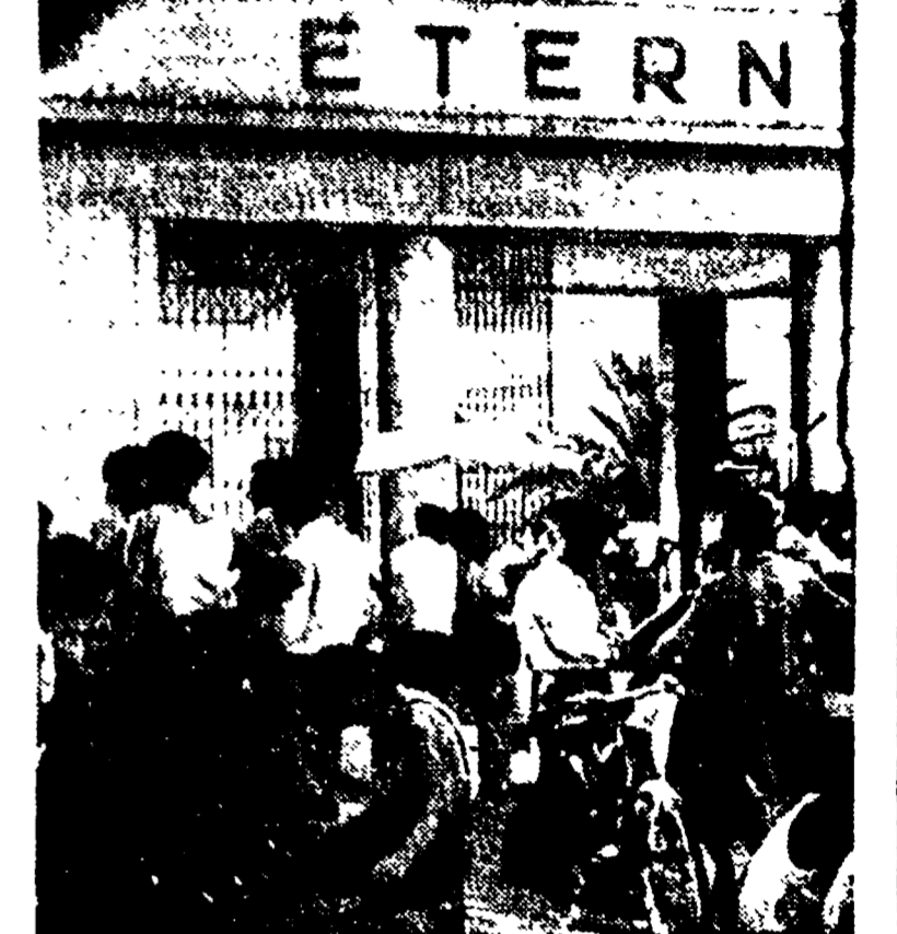
Alla Eternit la direzione ha chiesto 202 licenziamenti