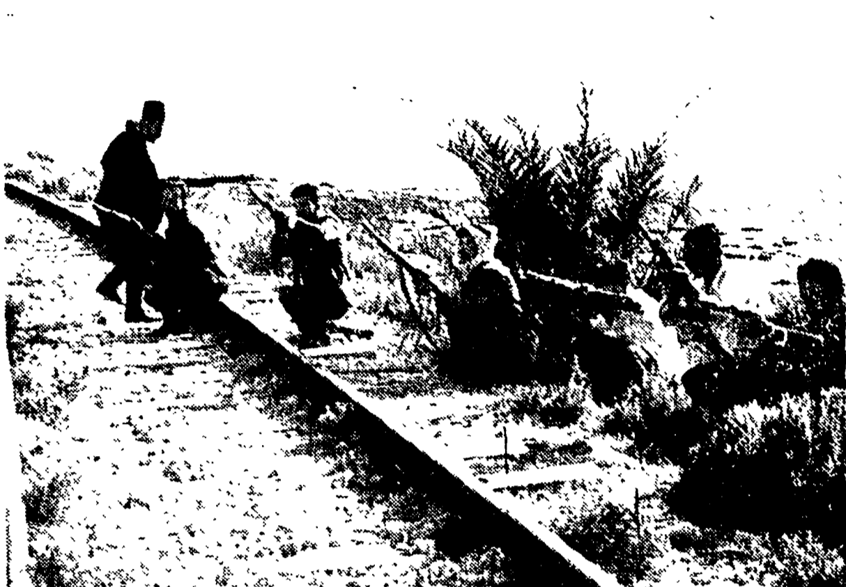
BEIRUT. - Un gruppo di sette partigiani antigovernativi presiedono un tratto della ferrovia Beirut-Sidone.