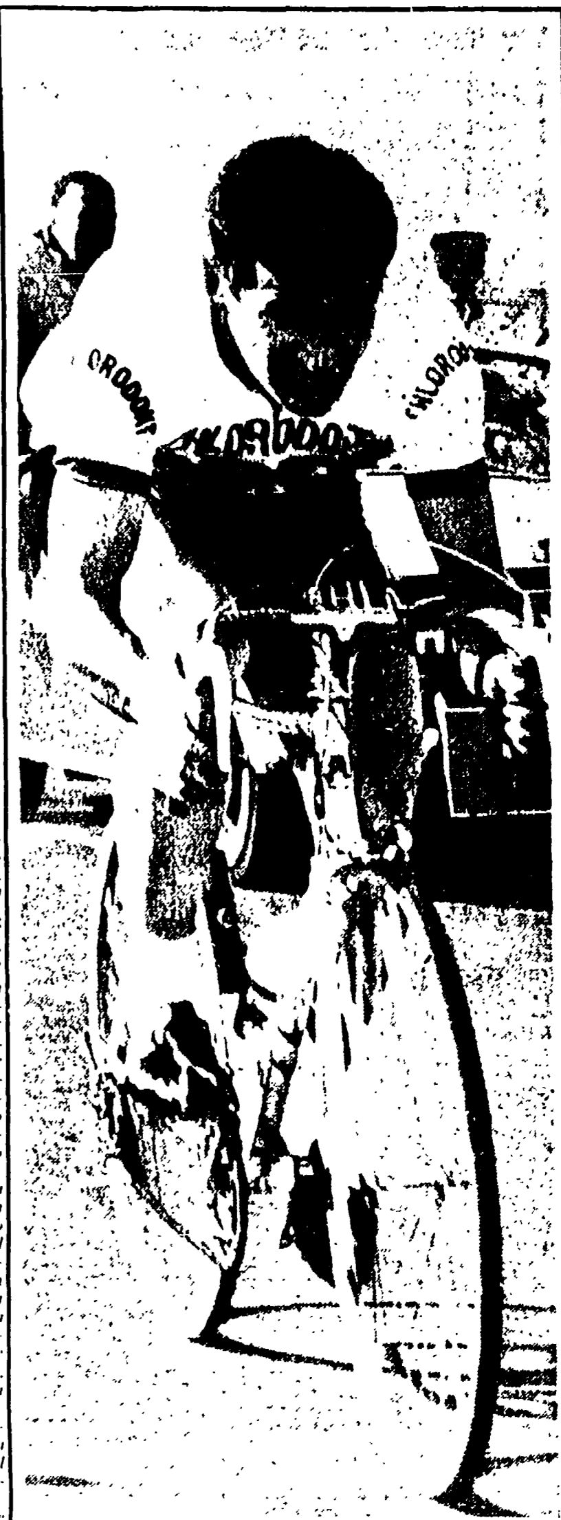
NENCINI, il capitano della squadra azzurra, sarà un osso duro per Anquetil, Bobet, Brankart, Bahamontes ecc. Gastone Nencini e il grande favorito di lui, ma nemmeno parte battito

Nencini è un corridore coraggioso, audace; e la sua nobiltà è conosciuta. Come l'arte di trattare con gli avversari. Auguriamogli dunque buona fortuna. Così a Binda e così ai gregari