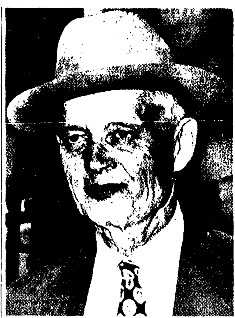
WASHINGTON — Il consigliere di Eisenhower Sherman Adams, implicato in questi giorni in un clamoroso scandalo...