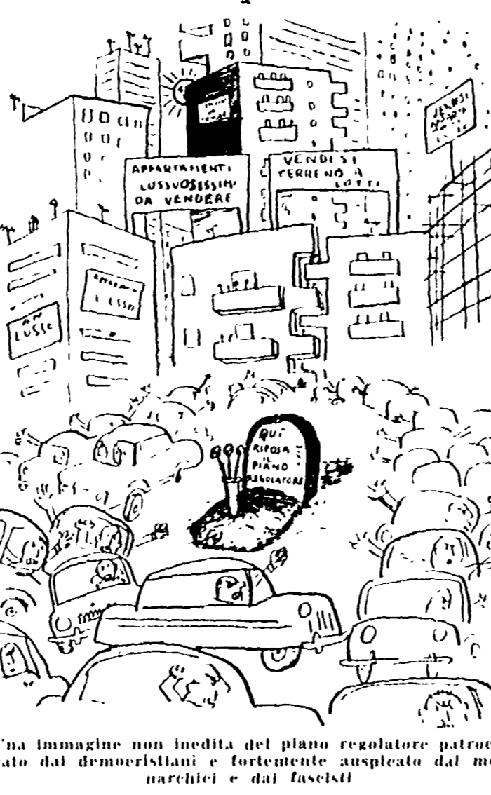
Una immagine non inedita del piano regolatore patrio, con i demarcatori e i fortissimi auspicati dal municipalista e dai fascisti.