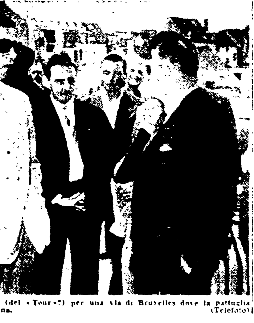
NENCINI e BINDA (dentro) (del "Tour") per una via di Bruxelles dove la pattuglia azzurra si trova da ieri mattina.

Ultimo Tour per Binda? Sì, forse, si può dire che il Tour è l'ultimo di una serie di imprese che Binda ha compiuto con successo.