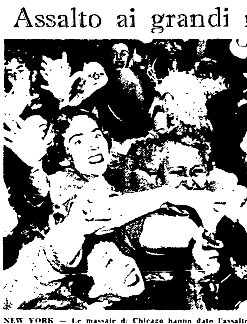
Assalto ai grandi magazzini

NEW YORK - Le masse di Chicago hanno dato l'assalto in massa ai grandi magazzini di Michigan Avenue che stanno svendendo la merce a prezzi eccezionalmente bassi. Erano un folto gruppo di donne che si accalcano presso i banchi di vendita per cercare di acchiappare cappelli «esclusivi» che da 125 dollari sono ribassati a 5 dollari (telefoto).