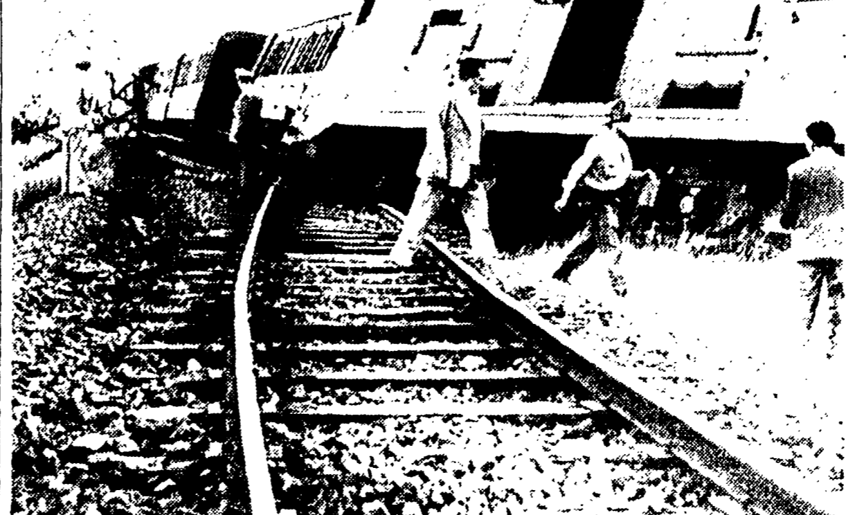
Una visione del grave incidente ferroviario accaduto ieri ad un passaggio a livello incustodito nei pressi di Ponte Galeria.

Il padre dell'autista è deceduto sul colpo - Cinque vagoni sono deragliati