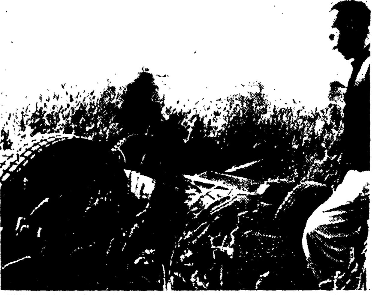
REIMS - Il campione del mondo Juan Manuel Fangio osserva la macchina di Musso, capovolta ai bordi della pista

Nel pauroso incidente il campione d'Italia ha riportato la frattura del cranio. E' deceduto in serata all'ospedale dove era stato trasportato d'urgenza