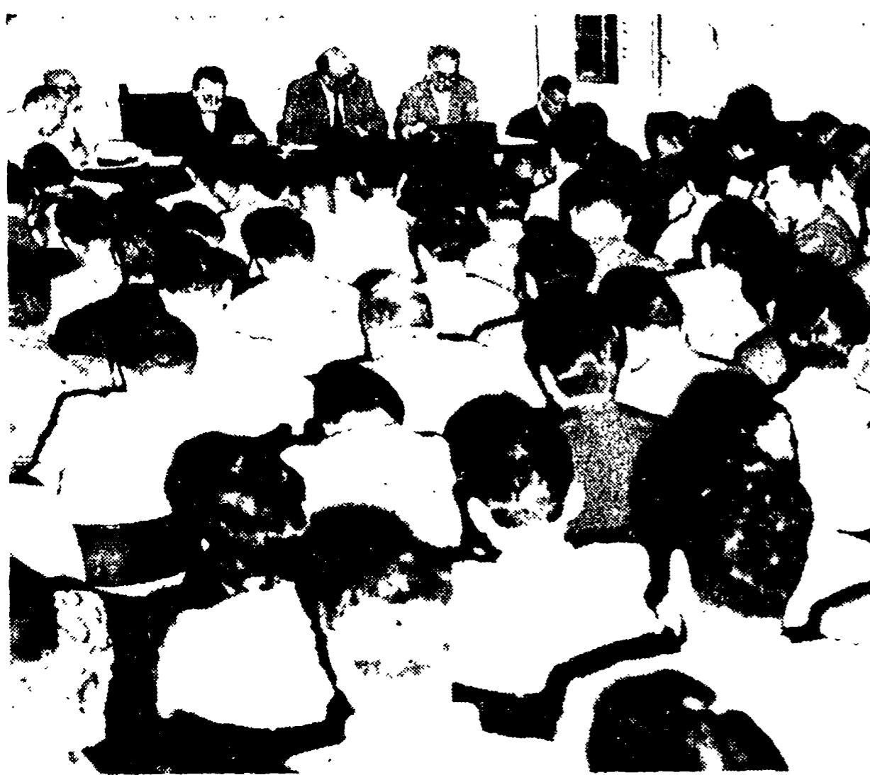
Alla presidenza dell'assemblea, da sinistra: Pagetta, Terracini, Togliatti, Novella e Longo

L'incontro nella sede del gruppo del PCI a Montecitorio - L'introduzione di Togliatti e la relazione di Longo - 70 aziende rappresentate - Contro il programma reazionario del governo Fanfani, il PCI si batterà per la massima occupazione per più alti salari, per far entrare la Costituzione nella fabbrica - Pubblicare il materiale della commissione d'inchiesta!