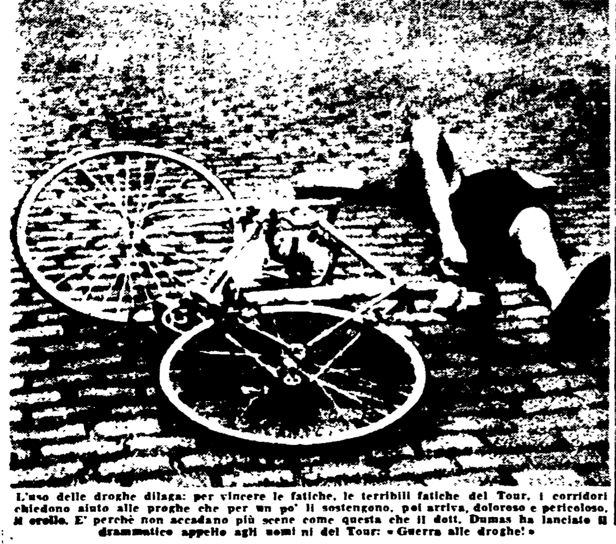
L'uso delle droghe dilaga: per vincere le fatiche, le terribili fatiche del Tour, i corridori chiedono aiuto alle droghe che per un po' li sostengono, poi arriva, doloroso e pericoloso, il crollo. E' perché non accadano più scene come questa che il dott. Dumas ha lanciato il drammatico appello agli nomi del Tour: «Guerra alle droghe!»

te uno stipendio. Ed è il padrone che fa il giro di Francia. I dottori delle squadre del «Tour», dice, «non sono altro che i padroni che fanno il giro di Francia...»