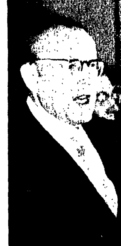
Il compagno Otto Grotewohl

re e di restare negli Stati Uniti come indossatrice e attrice. Ma ha aggiunto che suo padre, noto creatore di cappelli di Bruselles, e sua madre non sono soddisfatti all'idea di vederla rimanere in America. Se non vincerà non si abbandonerà alla disperazione e tornerà a fare l'indossatrice in Belgio.