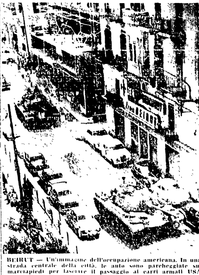
BEIRUT — Un'immagine dell'occupazione americana. In una strada centrale della città, le auto sono parcheggiate sui marciapiedi per lasciare il passaggio ai carri armati USA.

BOSTON, 19 — Il sommergibile «Piper» della marina statunitense si è arenato sabato su di un banco di sabbia al largo di Princeton. Ne l'unità ne l'equipaggio, composto da 100 uomini, corrono gravi pericoli. Due navi appoggio sono state inviate sul posto.