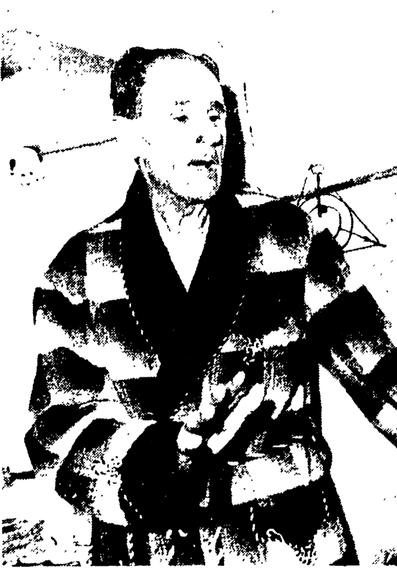
Il coraggioso autista dopo l'avventura

Il malvivente aveva noleggiato l'auto in piazza dei Cinquecento La reazione dell'anziano autista - Un furto compiuto in precedenza