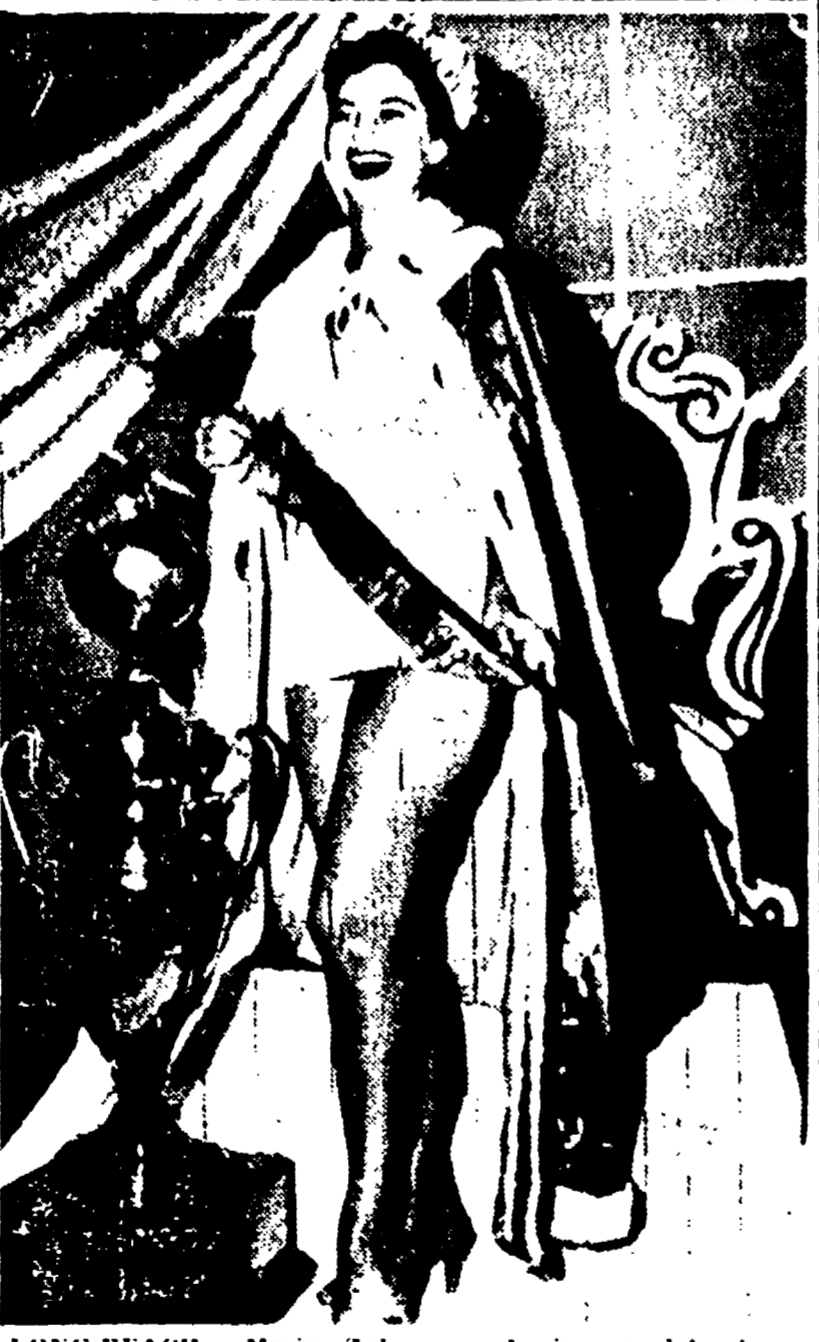
LONG BEACH - Marina Zuloaga con le insegne del potere dopo l'elezione (Telefoto)

Non vi è stato fatto in cambio italiano per l'esclusione di