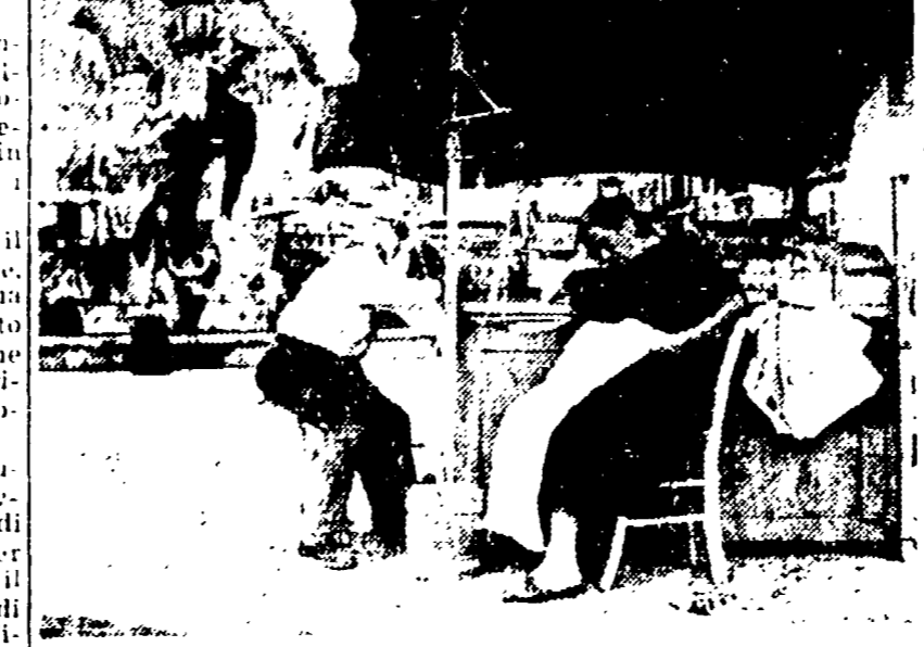
PIAZZA NAVONA - Venditori ambulanti, alle ore 11

UN ORDINE DEL GIORNO DEI COMUNISTI DI TIBURTINO III