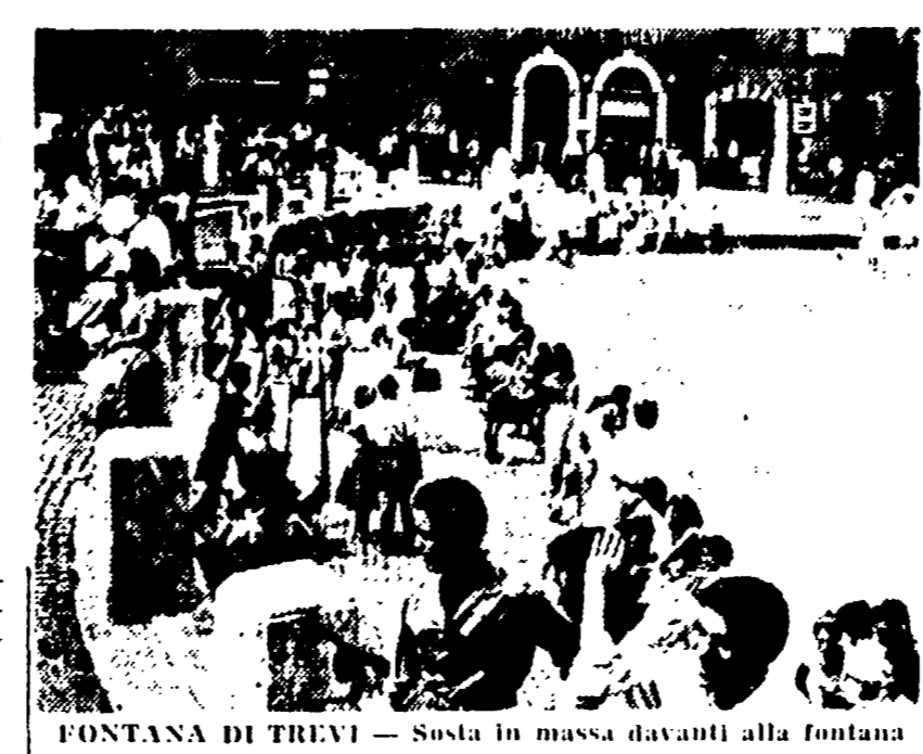
FONTANA DI TREVÌ - Sosta in massa davanti alla fontana