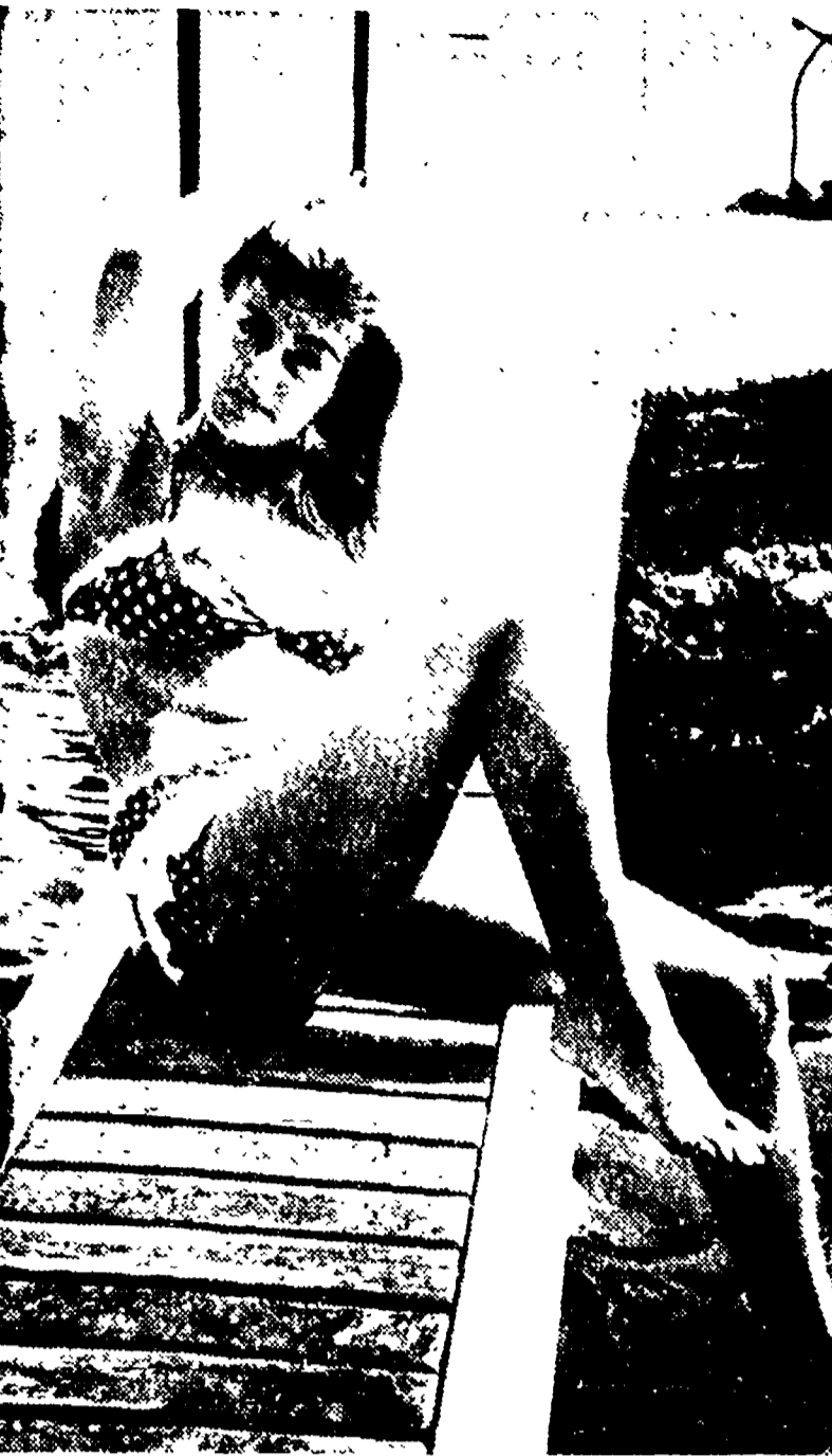
Dedicammo questa immagine refrigerante a quanti soffrono per l'eccezionale calore di questi giorni... (Dalla nostra redazione)