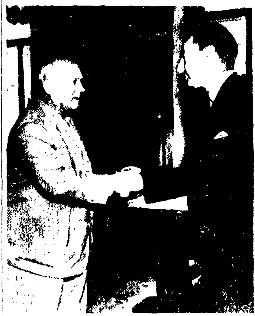
MOSCA - Il primo ministro sovietico, Krusciov, ha respinto la proposta britannica...