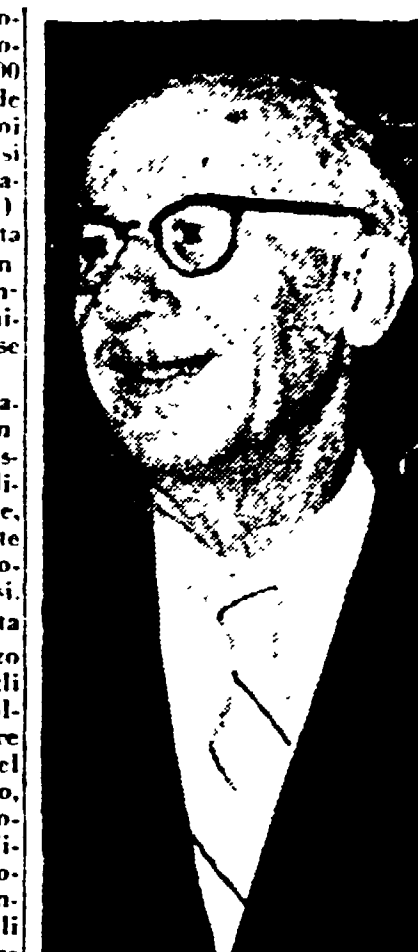
Il ministro Lami-Starnuti ha preannunciato nuovi licenziamenti nelle aziende di Stato